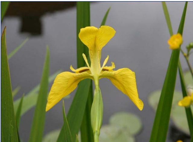
Iris pseudacorus , bloeit uit een schede

Door een presentatie in honderd schermen – dwz. op de wand geprojecteerde beeldschermen – werd het verschil tussen verscheidene bloemvormen en bloeiwijzen verduidelijkt. Daarbij dienden de ons bekende Gele lis en Gele plomp met de kleur geel als uitgangspunt. Beide planten hebben een nogal afwijkende bloei.