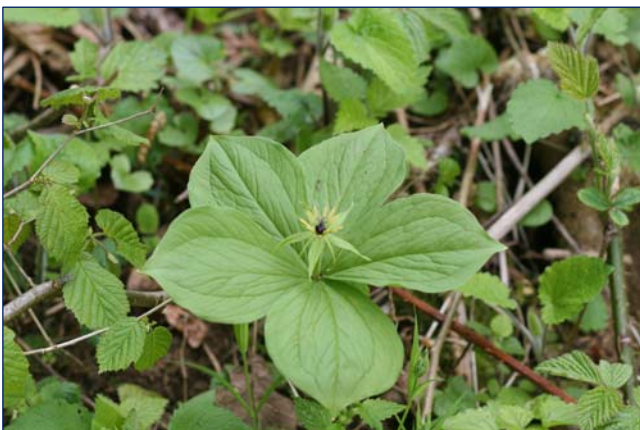
Paris quadrifolia , smal groen bloemdek

Het is opvallend dat vooral bij de monocotylen of eenzaadlobbigen een bloemdek voorkomt danwel velerlei bloeiwijzen binnen omhullend schutblad worden aangetroffen. Acorus calamus , de kalmoes, staat als een familie Acoraceae apart, naast de aronskelkgewassen of Araceae – naaktbloeiers binnen een omhullende schede, schutblad of spathe.