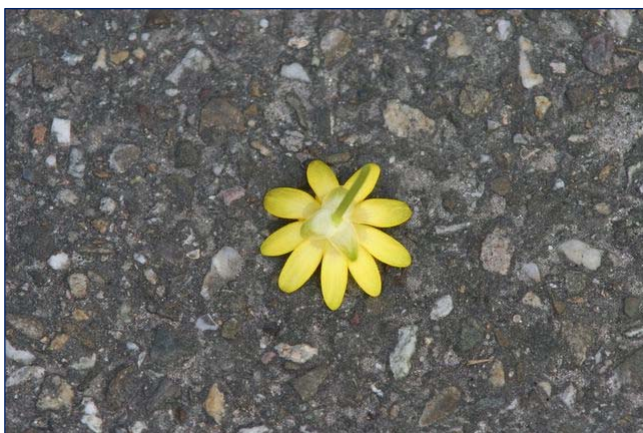
Ficaria verna , speenkruid

Bij ingewikkelde bloemen, zoals orchideeën maar vooral dicotylen of tweezaadlobbige planten is de term bloemdek zelden toepasselijk, hoewel soms een kelk niet duidelijk is. Als draad door de presentatie liep een regelmatig terugkerende verwijzing naar de composieten of samengesteldbloemigen die op de een of andere manier ons bloembeeld zo sterk hebben beïnvloed met zonnebloem, margriet en madeliefje. Dat zijn echter geen bloemen, maar bloeiwijzen! Bij zulke samengestelde bloemen is de kelk weinig meer dan wat kelkharen of kelkschubben tussen de afzonderlijke bloempjes, terwijl onder het geheel een omwindsel wordt gevormd. Een omwindsel vindt men vaak ook bij schermbloemigen onder het punt waar de schermvorm ontstaat. Een boterbloem heeft vijf kleine gele kelkbladen en vijf gele kroonbladen. Speenkruid was een wel heel gekke boterbloem: drie gele kelkblaadjes en negen kroonbladen, normaal gesproken. De soort hoort nu in een eigen geslacht.