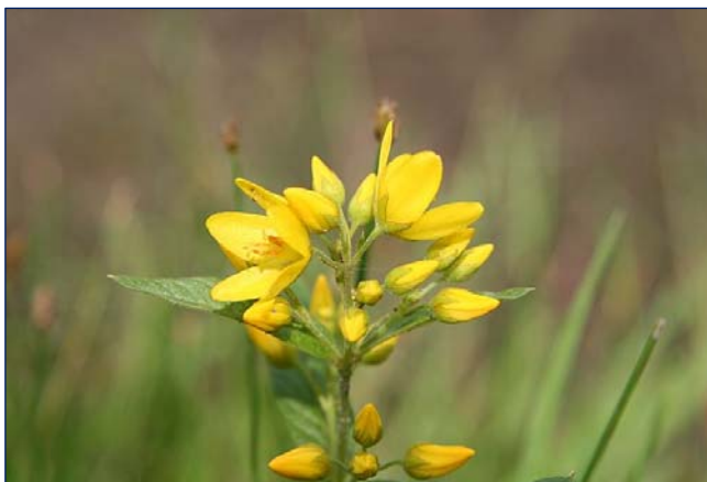
Wederik met aangedrukte kelkbladen

Bij het openbloeien kunnen kelkbladen een aparte rol vervullen ofwel in een kenmerkende houding om de bloemkroon gerangschikt zijn, aangedrukt danwel afstaand teruggebogen. Niet meegroeiend, groen, strak aangedrukt zien we oa. bij dotterbloem en wederik. Echter vertonen tennisbloem en ganzerik teruggebogen afstaande kelkbladen.